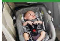
Автокресло «люлька» группы 0 (для детей массой < 10 кг)*

При покупке детского удерживающего устройства обязательно следует уточнить у продавца наличие сертификата на товар!