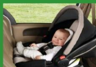
Автокресло группы 0+ (для детей массой < 13 кг)*