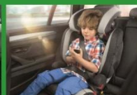
Автокресло группы II и III (для детей массой 15-36 кг)