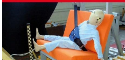
Результаты тестов использования небезопасных удерживающих устройств*