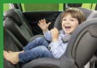
Автокресла группы I (для детей массой 9-18 кг)*