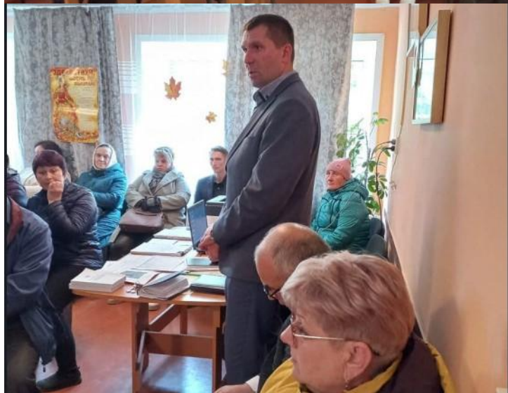
14 сентября 2021 года с концертной программой в МКУ «СДК» Безменовского сельсовета выступил творческий коллектив МБУ "РСКЦ" им. С.А.Жданько Черепановского района