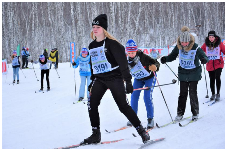
Итоги соревнований по лыжным гонкам «Лыжня России 2021»

14 февраля на базе детского оздоровительно образовательного лагеря "Радуга" в Черепановском районе состоялась Всероссийская массовая лыжная гонка "Лыжня России-2021"